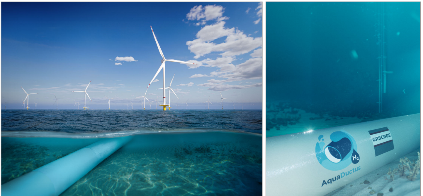
AquaDuctus Offshore Energieerzeugung, Transport Offshore-Wasserstoff-Pipeline.