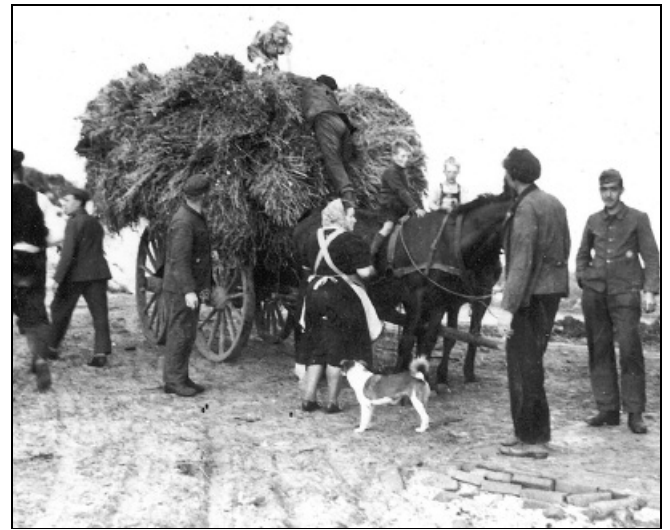
Französische Kriegsgefangene beim Ernteeinsatz auf der Domäne Eiland. 4

Auch heute noch werden vom Volksbund Deutsche Kriegsgräberfürsorge e.V. im Ausland gefallene deutsche Soldaten geborgen und auf einem der vielen Soldatenfriedhöfe einer würdigen Bestattung zugeführt. Auch die Angehörigen der gefallenen Soldaten und zivilen Opfer im Ausland trauern um ihre Angehörigen. Stanislaw Pienkowski und Czeslaw Jaworski blieb eine würdige Bestattung versagt. Ein sichtbares Zeichen an ihren gewaltsamen Tod fehlt. Gleich dem Gedenken an deutsche Soldaten im Ausland, sollte auf unserer Insel die Erinnerung an Stanislaw Pienkowski und Czeslaw Jaworski wach bleiben.